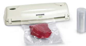
Sacchetti e rotoli | Rolls and bags