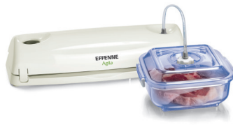
Contenitori rigidi | Rigid containers