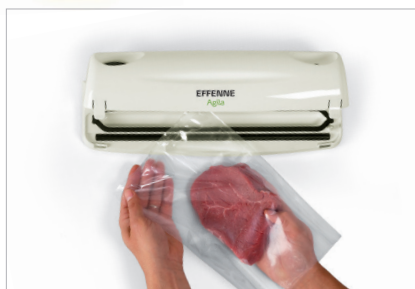
Inserire l'alimento nel sacchetto Fill the bag with food

* I CIBI DURANO FINO A 5 VOLTE DI PIÙ / FOOD LASTING UP TO 5 TIME LONGER