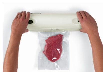
Un semplice click e tutto avverrà automaticamente in pochi secondi Simply click down and automatically vacuum pack in just a few seconds