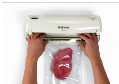
Posizionare il lato aperto nella vaschetta Place the open end of the bag in the tray