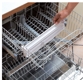
Vaschetta lavabile in lavastoviglie Tray washable in dishwasher